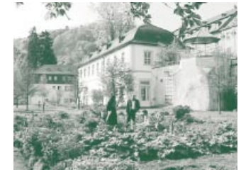
In mittelalterlichen Klöstern wurden Dutzende verschiedenartiger Heilpflanzen gezüchtet.

Auch heute noch kann man sich einen kleinen Kloostergarten auf dem Balkon oder im Garten anlegen. Dafür benötigt man nicht Dutzende von verschiedenartigen Pflanzen wie man sie in mittelalterlichen Kloostergärten vorfand. Auch eine kleine Handvoll tut gute Dienste. Vier, die man einfach bekommt und die nicht viel Pflege brauchen, haben wir dafür ausgewählt.