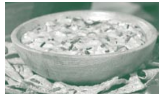
Der Dip mit Traubenkernöl schmeckt zum abendlichen Weinschoppen.

Als erstes die Tomaten, die Avocado und das hartgekochte Ei in kleine Stücke schneiden und mit den fünf Esslöffeln Joghurt vermischen. Anschließend einen halben Teelöffel Sambal Oelek darunterrühren. Das Ganze mit einem Esslöffel Traubenkernöl verfeinern, und als letztes mit einer Prise Curry und etwas Salz abschmecken.