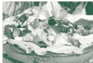
Traubenkernöl hat einen ungewöhnlichen Geschmack und ist ausgesprochen gesund.

Pfefferkörner andrücken und zu Knoblauch und Schnittlauch in eine