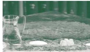
Traubenkern-Ciabatta à la hobbythek.

Backblech mit Backpapier oder in eine gefettete Kastenform geben und nochmals eine Stunde gehen lassen. Den Backofen auf 180°C vorheizen. 40 Minuten backen.