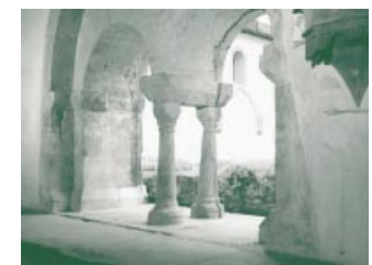
In den Klöstern lebten neben zahlreichen Kopisten auch heilkundige Brüder.