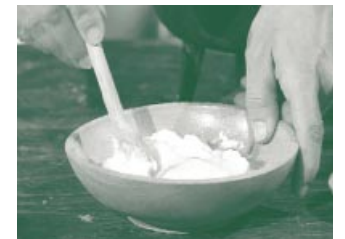
Aloe versorgt trockene und spröde Haut mit Feuchtigkeit.