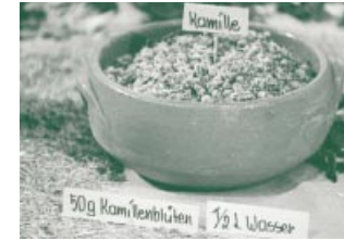
Heilpflanzen und Wickel – eine ideale Ergänzung.

Die Blüten ins aufgekochte, noch heiße Wasser einrühren. Etwa drei Minuten ziehen lassen und anschließend abseihen. Die warmen, keinesfalls heißen (Verbrennungsgefahr!) Blüten auf das Innentuch verteilen und ringsum einschlagen. Dann auf die Haut legen und mit den zwei Tüchern wie oben beschrieben einwickeln. Die Packung sollte so lange einwirken, bis die Kamillenblüten abgekühlt sind.