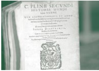
Plinius' Monumentalwerk war eine Art frühe medizinische Enzyklopädie.

landes besonders nachhaltig. Plinius der Ältere galt schon in der Antike als ein Allroundgenie, denn neben seiner Tätigkeit als Feldherr, Flottenchef und Politiker war seine echte Leidenschaft die Naturwissenschaft. In einem 37-bändigen Monumentalwerk fasste Plinius das gesamte medizinische Wissen der griechischen und römischen Antike zusammen - eine Art frühe medizinische Enzyklopädie.