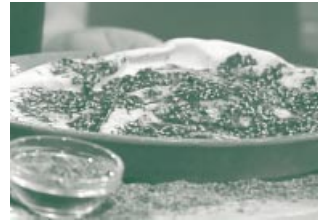
Gesunder Pausensnack aus Saudi Arabien – Thymianbrot.

Das Brot mit Olivenöl beträufeln, Thymian und Sesam darüber streuen und nach Geschmack salzen. In einigen arabischen Lebensmittelgeschäften sind auch fertige Gewürzmischungen unter dem Namen „sātar“ erhältlich, die nur noch unter das Olivenöl gerührt werden müssen.