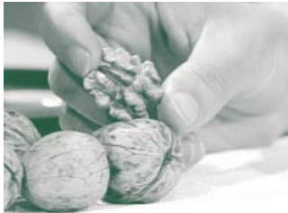
Äußerlich ähnelt die Walnuss dem menschlichen Gehirn. Die Menschen im Mittelalter glaubten deshalb, dass diese Frucht Erkrankungen des Gehirnes heilen könnte.

Darin ging er davon aus, dass die vier Säfte Blut, Schleim, gelbe und schwarze Galle sich im menschlichen Körper im Gleichgewicht befinden. Verschiebt sich das Gleichgewicht, so erkrankte der Mensch.