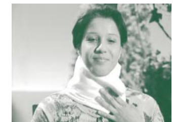
Entscheidend ist, dass man sich mit dem Wickel wohlfühlt.