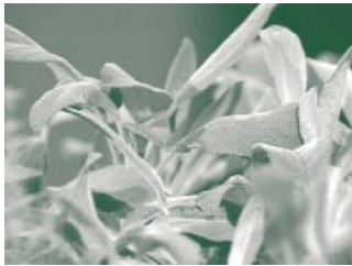
Salbei hat vorzügliche antiseptische Eigenschaften.

Ein wohlschmeckender Tee lässt sich aus Salbei zubereiten. Aber über den Geschmack hinaus entwickelt Salbei auch eine ganz besonders intensive Heilwirkung. Das kann man auch schon am Namen erkennen. Der lateinische Namen „Salvia“ leitet sich von „salvare“ ab, was so viel bedeutet wie „heilen“ oder „bewahren“. Das zeigt, wie universell Salbei in der frühen Heilkunde eingesetzt wurde. Er fehlte in keinem Klostergarten. Der mehrjährige Strauch wird bis zu 50 Zentimeter hoch. Am besten gedeiht er in