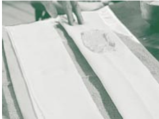
Quarkwickel lindern Halsschmerzen.