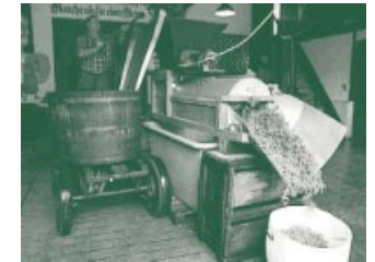
Selbst aus dem Abfall lässt sich noch ein hochwertiges Mehl herstellen.