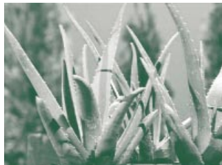
Schlicht und genügsam, aber mit erstaunlicher Heilwirkung - die Aloe vera.

Im Himalaya heißt sie „Kumari“, die lebende Göttin, in Mexiko „Sábila“, die Wissende, und auch bei uns ist sie unter Bezeichnungen wie „Pflanze der hundert Wunder“ bekannt: die Aloe vera. Sie erlebt zur Zeit eine richtiggehende Renaissance - fast überall auf der Welt. Die Aloe-Pflanzen, die man bei uns bekommt, werden vor allem in Spanien, auf Malta und den Kanaren angebaut. Die weltweit größten Plantagen allerdings liegen in Texas, Florida und Mexiko. Die Aloe ist von Natur aus an extreme Umweltbedingungen angepasst. Als Bewohnerin extrem trockener Standorte steht ihr mit dem Gel, das in ihren dicken fleischigen