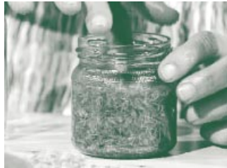
Auf der Fensterbank müssen die Calendula-Blüten drei Wochen lang auf das Öl einwirken.

besten ein kaltgepresstes Olivenöl. Das Glas verschließen und an einen