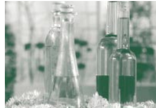
Kaltgepresste Öle sind allemal besser als raffinierte.

wichtig, dass das Öl kalt gepresst wird. Weil schonend hergestellt, enthält es mehr Vitamine, Geschmacksstoffe und essentielle Fettsäuren als raffinierte Öle.