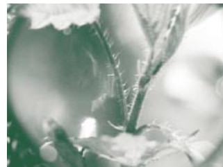
Die feinen Härchen der Brennnessel erinnern an menschliches Haar.

Viele Ansichten der mittelalterlichen Medizin sind veraltet und mit unserem heutigen naturwissenschaftlichen Wissen kaum vereinbar. Doch auch wenn wir heute über solche Vorstellungen lächeln: Wir dürfen nicht vergessen, dass sie den Menschen des Mittelalters durchaus geholfen haben. Die Signaturenlehre und auch die Vier-Säfte-Lehre brachten System ins Chaos. Die Pflanzenvielfalt war auf einmal überschaubar und es wurde möglich, aus der Vielzahl die Wildpflanzen herauszufinden, die tatsächlich gegen bestimmte Krankheiten wirken.