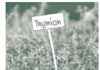
Beim Thymian haben Bakterien kaum eine Chance.