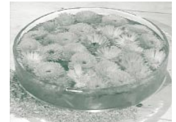
Die schönen Blüten der Ringelblume lassen sich zu hautfreundlichen Kosmetika verarbeiten.