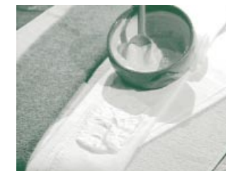
Für einen heilenden Wickel braucht man nicht viel.

Noch etwas ist ganz entscheidend: Derjenige, dem ein Wickel angelegt wird, muss sich mit damit wohl fühlen. Der Wickel darf also nicht zu eng angelegt sein. Außerdem muss die Temperatur stimmen. Fängt man z. B. nach einigen Minuten an zu frieren, sollte der Wickel schleunigst wieder abgenommen werden.