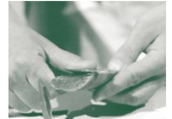
Das wertvolle Gel lässt sich schnell freilegen.