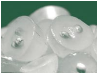
Traubenkerne sind mehr als nur Abfall.

sen. Ein Gläschen Rot- oder Weißwein pro Tag kann Herzerkrankungen vorbeugen und das schädliche LDL-Cholesterin senken. Verantwortlich hierfür sind sogenannte Polyphenole.